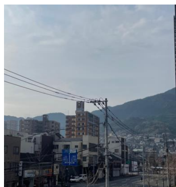
バルコニーからの風景