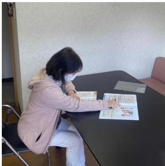
会議室 & 相談室の様子